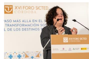
Iniciativas de la Secretaria de Estado de Turismo para la transformación sostenible y digital del sector turístico.