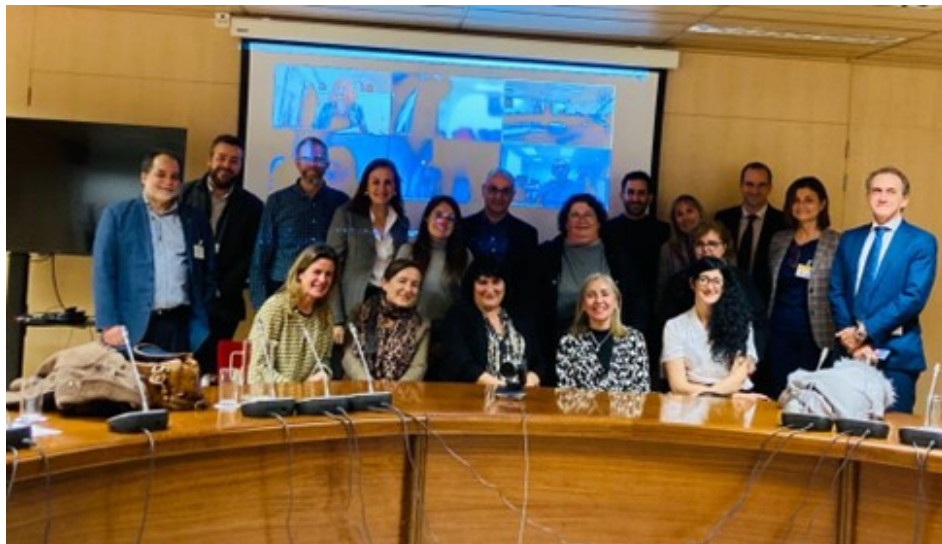
Miembros del GT-CT durante la reunión celebrada el 24 de enero de 2024 en Madrid.

Más detalle de las diferentes líneas de acción del SSTI aquí