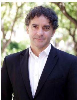
1 - Francesc Colomer, secretario autonómico de Turismo de la Comunitat Valenciana.

La Ley de Turismo, ocio y hospitalidad de la Comunitat Valenciana, contempla las acciones de impulso a la calidad del sector turístico, llevadas a cabo a través del programa Qualitur, a partir de una estrategia de actuación global y dirigidas a fomentar una oferta sostenible y accesible, así como una óptima, hospitalaria e igualitaria.