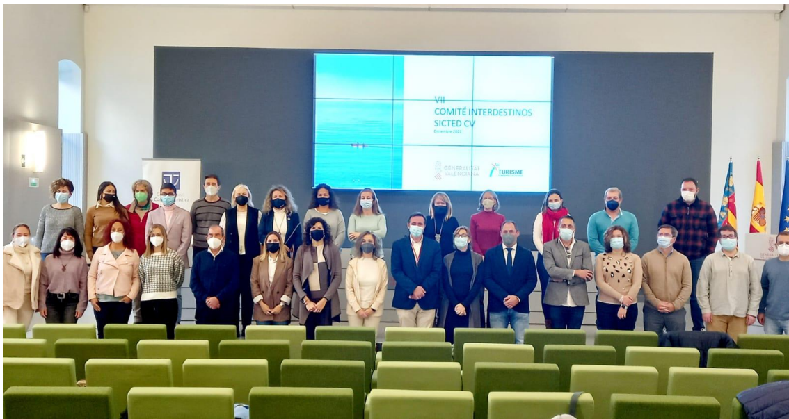
3 - Miembros del Comité Interdestinos SICTED de Comunitat Valenciana

¿Qué valoración hacen de este modelo de implantación del SICTED, así como de la colaboración con las Cámaras de Comercio? ¿En qué medida se ve afectado el grado de aceptación y permanencia en el proyecto por la implicación directa de la comunidad autónoma en su coordinación y, sobre todo, por el apoyo prestado a los destinos para la realización de las principales actuaciones del programa?